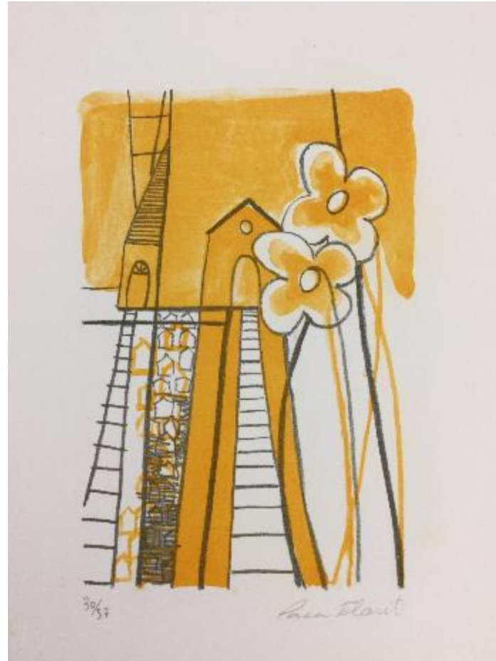
PACO ESPINOSA / PACA FLORIT